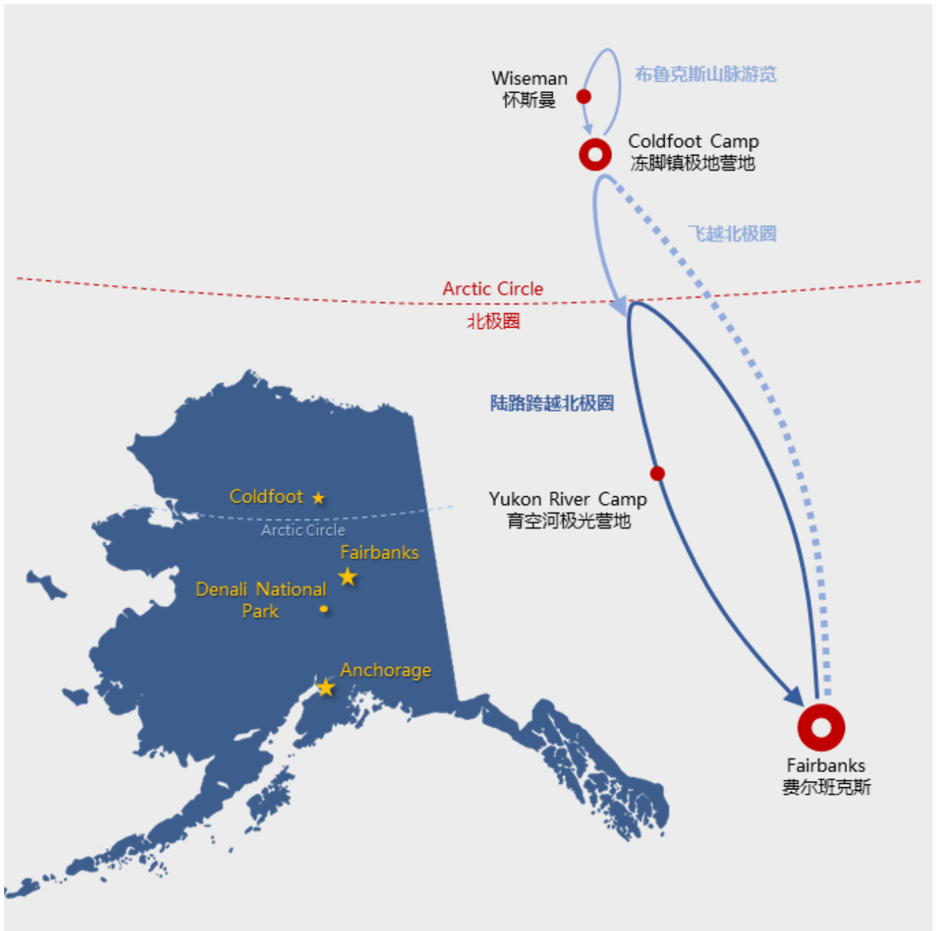
陆路跨越北极圈、飞越北极圈线路示意图