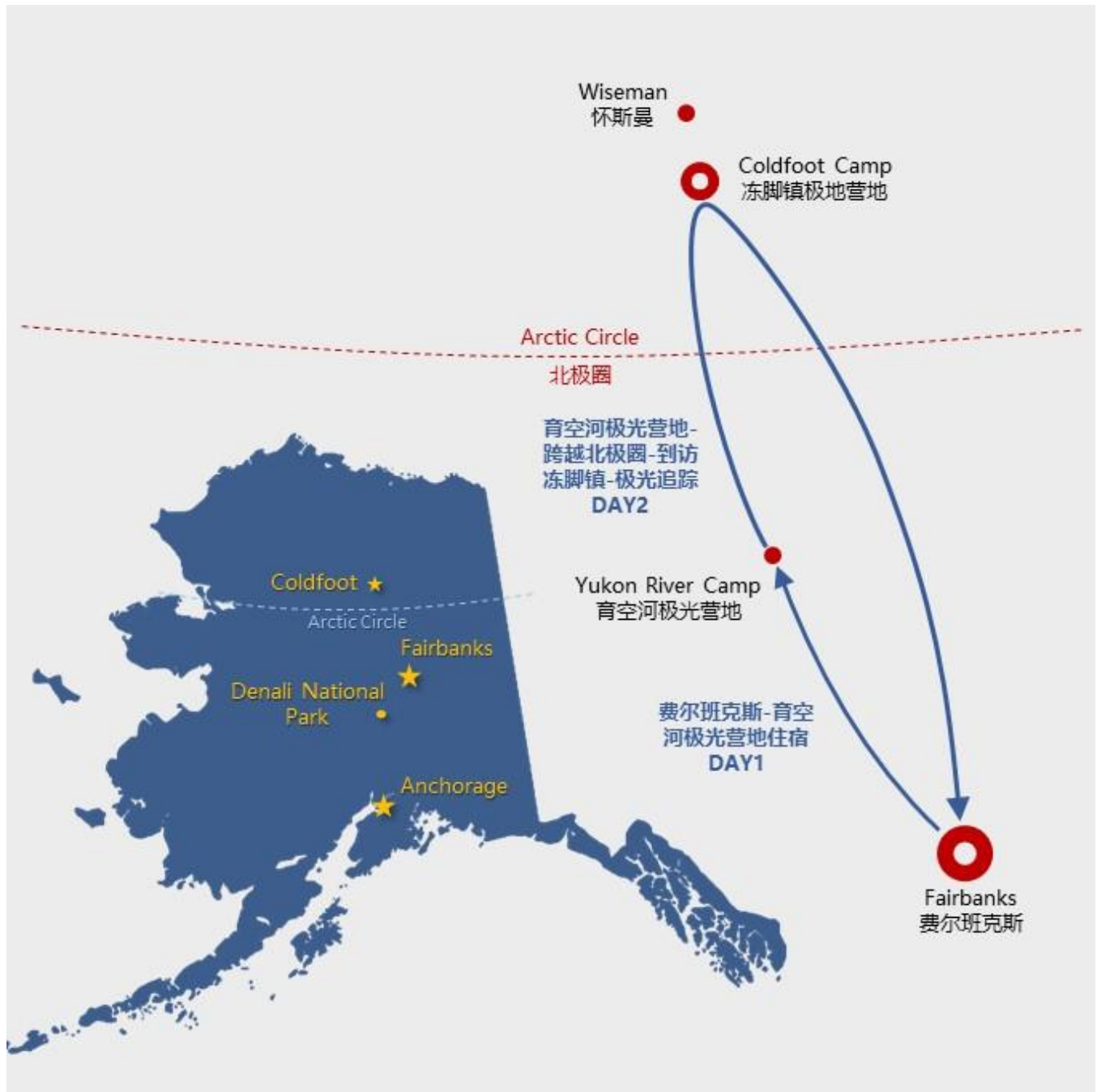
北纬 66°育空河极光营地住宿 2 天 1 晚之旅示意图