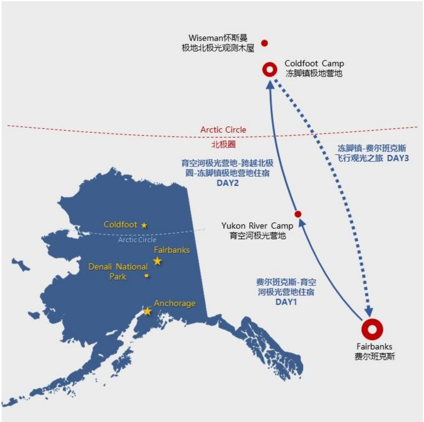
极地双营地住宿 3 天 2 晚飞越北极圈之旅示意图 (DAY3 含冻脚镇-费尔班克斯极地观光飞机)