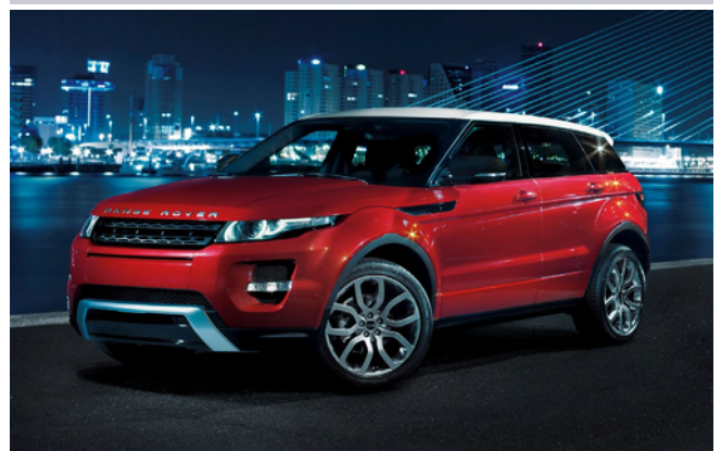
其他豪華車型, 具體細節請來電諮詢