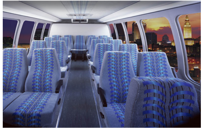
24-40座中巴：舒適高靠背座椅，空調暖氣，麥克風話筒，後側獨立行李箱（司導分開）