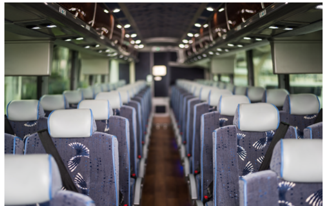
54-61座大巴：舒適高靠背座椅，空調暖氣，麥克風話筒，後側獨立行李箱，應急簡便洗手間 司導分開