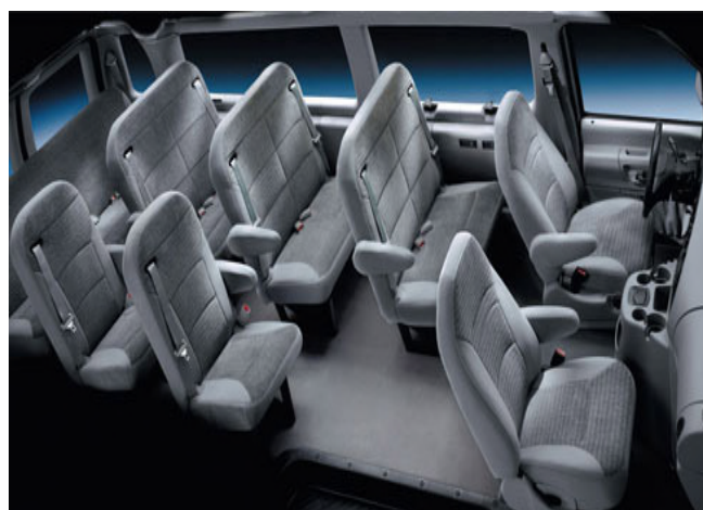
12座平顶车：最多可乘坐10位乘客，座位后侧放置行李，空调暖气司兼导或司导分开均可