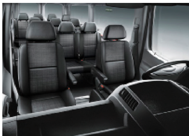
15座奔驰高顶：最多可乘坐12位乘客，座位后侧放置行李，空调暖气司兼导或司导分开均可