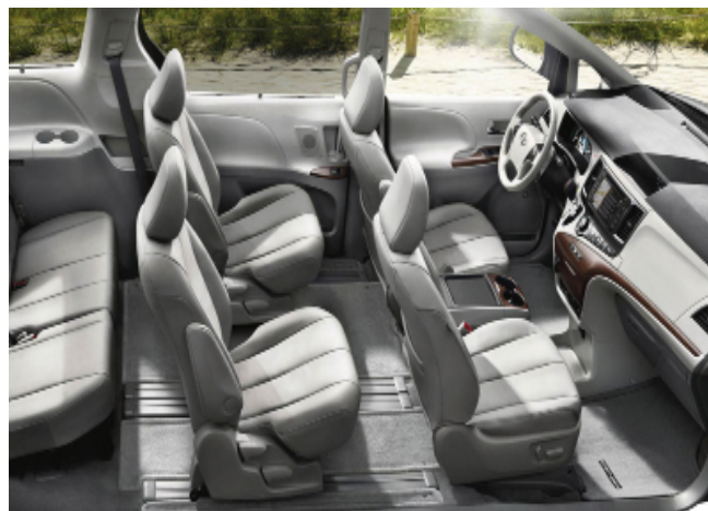
7座商务车：最多可乘坐5位乘客，座位后侧放置行李，空调暖气司兼导或司导分开均可