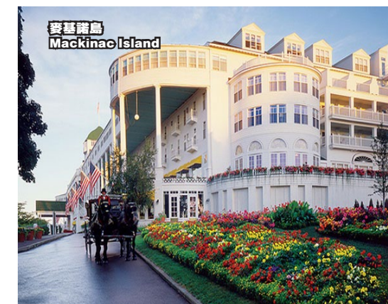
麥基諾島 Mackinac Island