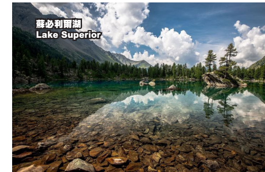
蘇必利爾湖 Lake Superior