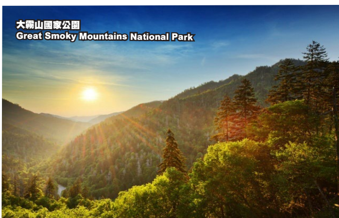
大霧山國家公園 Great Smoky Mountains National Park