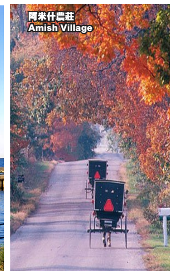
阿米什農莊 Amish Village