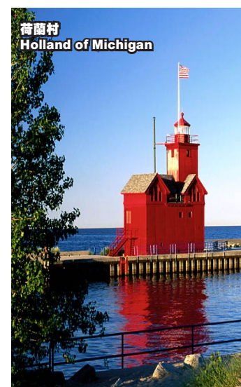
荷蘭村 Holland of Michigan