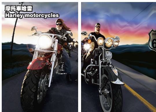
摩托車哈雷 Harley motorcycles