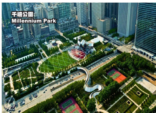
千禧公園 Millennium Park