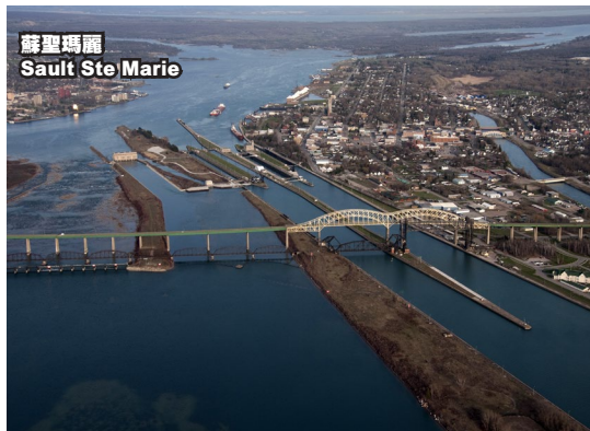
蘇聖瑪麗 Sault Ste. Marie