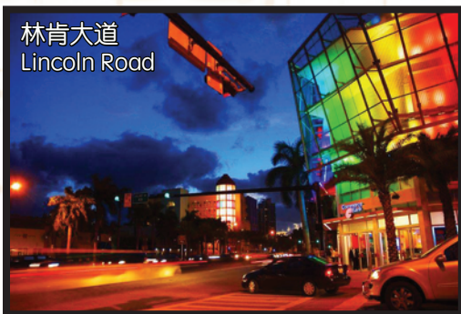
林肯大道 Lincoln Road