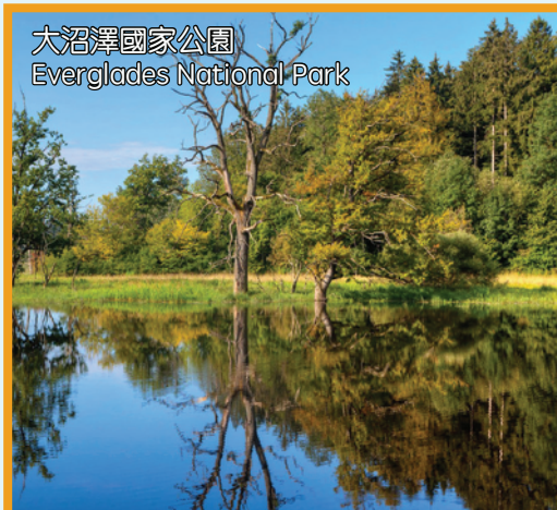
大沼澤國家公園 Everglades National Park