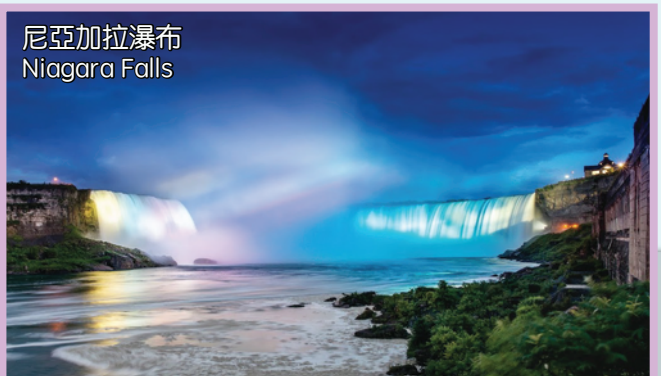
尼亞加拉瀑布 Niagara Falls

酒店：Sheraton/ DoubleTree/Radisson/Courtyard/Four Points/Wyndham/Holiday Inn或同級