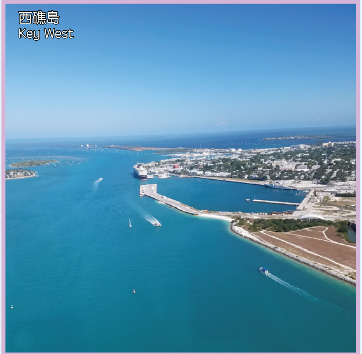
西礁島 Key West

Enjoy the day free from the group tour 7 different itineraries options will be provided for best meeting with your demanding.