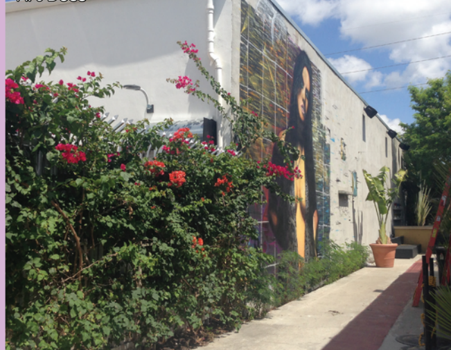
裝飾藝術區 Art Deco

酒店: Ramada Plaza Fort Lauderdale/ Sawgrass Grand Hotel / Quality Inn/ Days Inn或同級 (提供免費早餐)