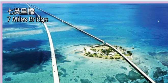
七英里橋 7 Miles Bridge

酒店: Ramada Plaza Fort Lauderdale/ Sawgrass Grand Hotel / Quality Inn/ Days Inn或同級 (提供免費早餐)