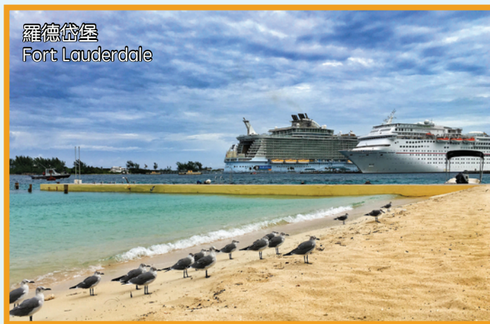
羅德岱堡 Fort Lauderdale