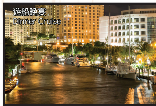
遊船晚宴 Dinner Cruise