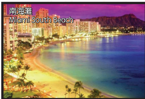
南海灘 Miami South Beach