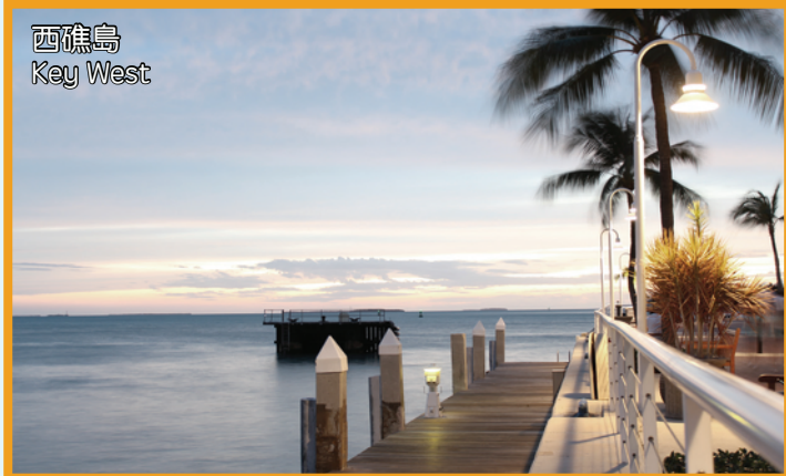
西礁島 Key West

酒店: Ramada Plaza Fort Lauderdale/ Sawgrass Grand Hotel / Quality Inn/ Days Inn或同級 (提供免費早餐)