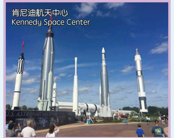
肯尼迪航天中心 Kennedy Space Center

酒店: Ramada Deluxe Tower Hotel / Park Inn By Radisson 或同級酒店 (提供免費早餐)