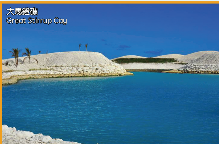
大馬鐙礁 Great Stirrup Cay