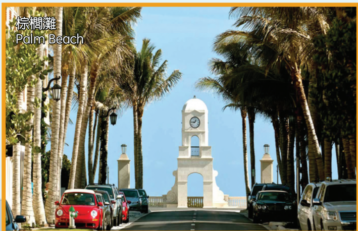
棕櫚灘 Palm Beach