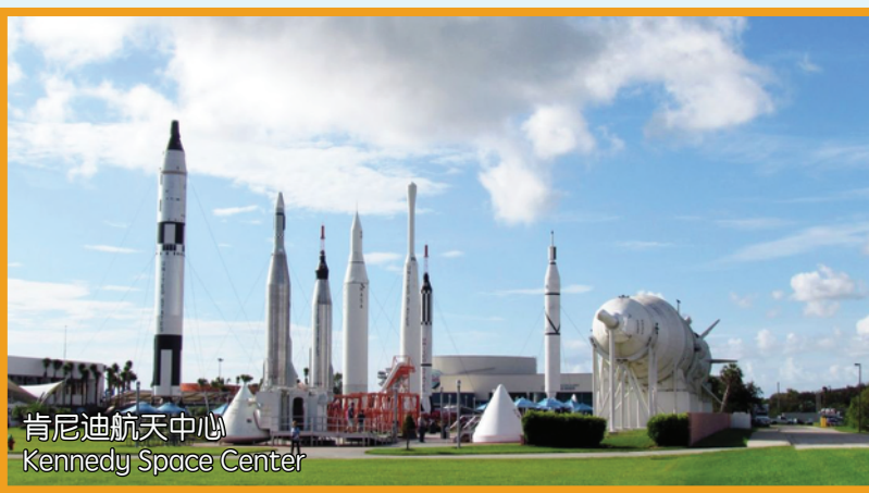
肯尼迪航天中心 Kennedy Space Center