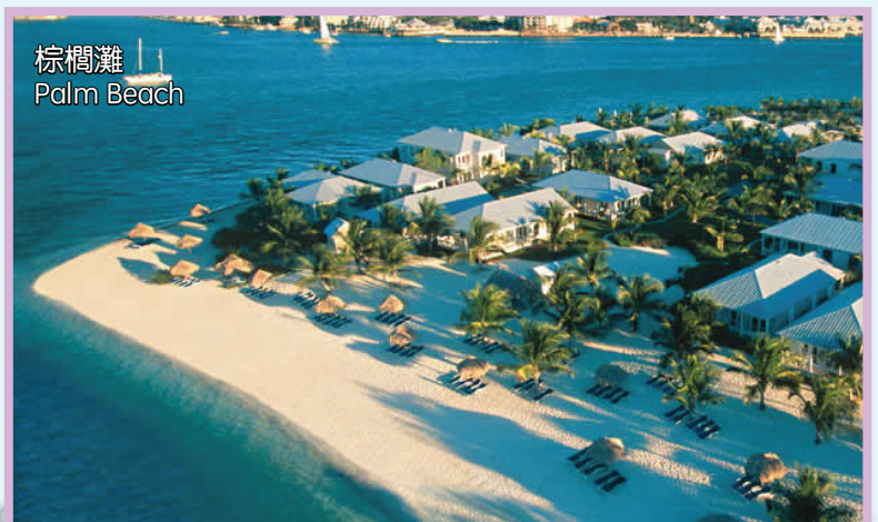
棕櫚灘 Palm Beach