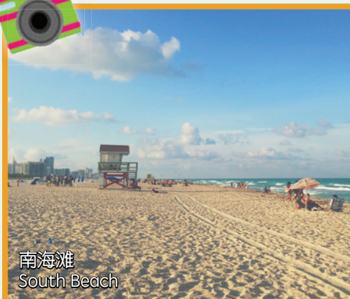
南海灘 South Beach