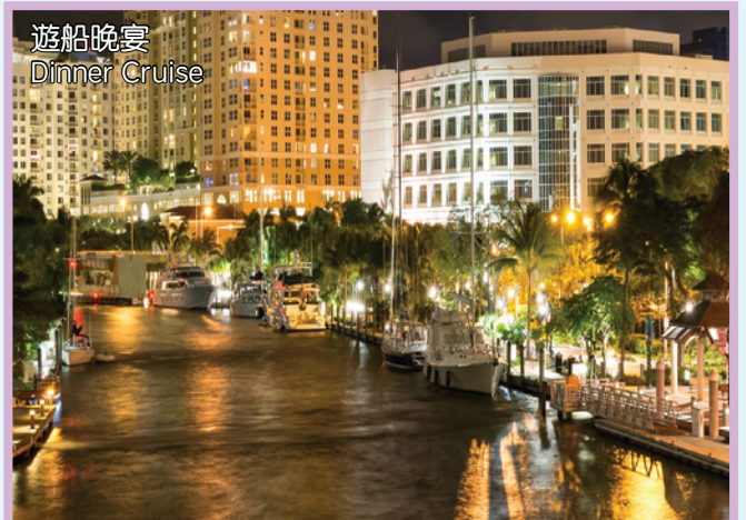
遊船晚宴 Dinner Cruise

酒店: Ramada Plaza Fort Lauderdale/ Sawgrass Grand Hotel / Quality Inn/ Days Inn或同級 (提供免費早餐)