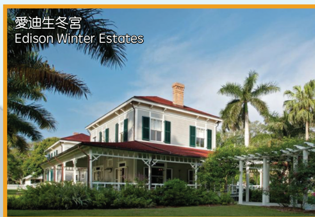
愛迪生冬宮 Edison Winter Estates

酒店: Ramada Plaza Fort Lauderdale/ Sawgrass Grand Hotel / Quality Inn/ Days Inn或同級 (提供免費早餐)