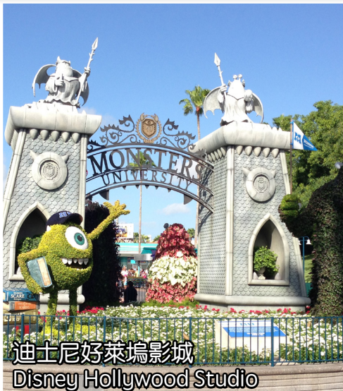
迪士尼好萊塢影城 Disney Hollywood Studio

樂園以好萊塢電影為主題，園內的遊戲和餐廳都以電影電視場景為藍本，不僅有老少皆宜的遊樂項目，還可以欣賞百老匯音樂劇！