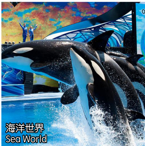
海洋世界 Sea World

樂園的整體主題是一趟探索的旅程, 遊客從主要的港口出發前往六座分別有不同主題的島嶼, 每座島嶼都強調了冒險的要素。