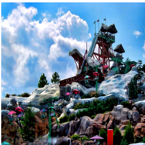
迪士尼暴風雪水上樂園 Disney Blizzard Beach

公主王子加米奇米妮，每晚的煙火以城堡為背景，還會有Tinker Bell從空中飛過，帶您回到童話世界！