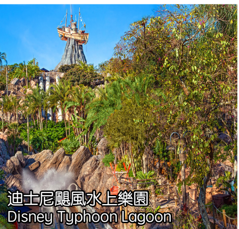
迪士尼鰐風水上樂園 Disney Typhoon Lagoon

Key West 從酒店往南駛向佛羅裡達群島鏈的最末端-被譽為“美國天涯海角”的西礁島, 一路上五彩斑斕的海面和湛藍的天空構成獨一無二的美景。途中將跨越一條宏偉的“跨海大橋”, 它是由長短不一的42座橋和32個島嶼串連而起, 也被稱為“世界第八大奇觀”。還將會停留阿諾施瓦辛格的“真實的謊言”的拍攝地, 著名的“七英里橋”。到達西礁島之後, 您可以在“美國大陸最南端”的地標前合影留念, 還可以自行參觀諾貝爾文學獎得主海明威故居。 酒店: Holiday Inn Miami West-Airport Area/Holiday Inn Express&Suites Miami Airport/Holiday Inn Express&Suites Pembroke Pines 或同級(提供免費早餐)