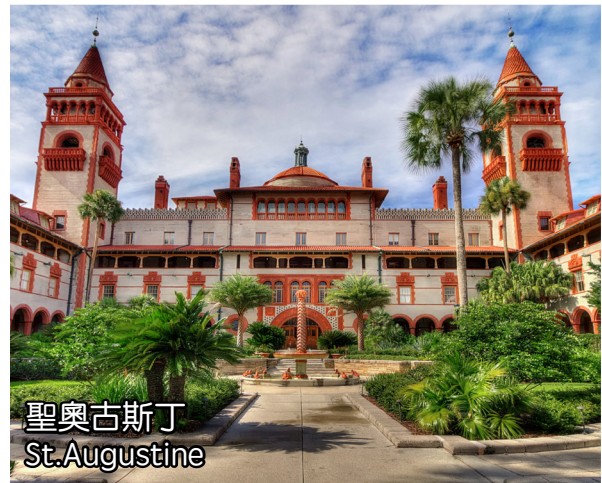
聖奧古斯丁 St. Augustine

Travel to St. Augustine in the morning, we will visit the famous Castillo de San Marcos, Fountain of Youth. Later, we walk down to the St. George St to visit the oldest college of Florida, Flagler College. We will climb to the top of the lighthouse to see the entire of the town. We return to Orlando at 6:00PM.