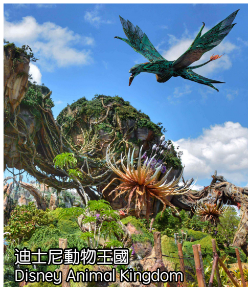
迪士尼動物王國 Disney Animal Kingdom

樂園以暴風雪襲擊後的沙灘為主題，到處都有冰雪裝飾。擁有世界上最長的家庭式仿急流水滑道-全家一起齊歡樂！