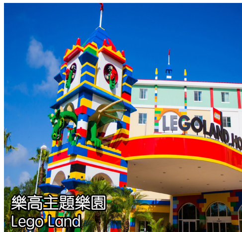
樂高主題樂園 Lego Land

(離團航班為羅德岱堡機場(FLL)15:00-18:00的航班 & 邁阿密機場(MIA) 15:00-19:00的航班; 或去往郵輪碼頭乘坐郵輪)行程如下: 上午前往邁阿密以北, 負有盛名的“世界遊艇之都”-羅德岱堡, 您將遊覽“美國的威尼斯”, 漫步羅德岱堡海灘。隨後將會帶您前往美國高檔購物中心Bloomingdale's購物, 同時您可以獲得九折購物卡以及獨家滿額贈送活動, 總消費滿$7500(稅前), 即可獲贈價值$400的蘋果店禮品卡。(備註: 購物後請到訪客中心兌換贈品(導遊協助客人兌換贈品), 如指定禮品兌換完畢, 會換成其他等價的禮品。購物結束後, 我們將送您前往機場或碼頭。(15:00-18:00之間的航班或是最後一天下午繼續乘坐郵輪, 將沒有機會去西礁島。我們會安排專人送至機場, 碼頭。羅德岱堡碼頭(POE/邁阿密碼頭(POM))13:00-15:00。) (Bloomingdale's購物中心每週日的開門時間是中午12點, 如果您離開邁阿密的時間恰逢週日, 您將無法前往Bloomingdale's進行購物。我們會直接送您去機場或者碼頭) (離團航班為羅德岱堡機場(FLL)18:00後的航班 & 邁阿密機場(MIA)19:00後的航班)行程如下: 上午前往邁阿密以北, 負有盛名的“世界遊艇之都”-羅德岱堡, 您將遊覽“美國的威尼斯”, 漫步羅德岱堡海灘。接著前往美國南部唯一一座集駕車以及步行體驗於一體的野生動物王國, 與近千頭野獸近距離接觸, 猶如身處非洲草原。隨後我們將經過西棕灘市去往棕櫚灘島, 外觀美國總統特朗普私宅-海湖莊園以及建於1902年的亨利·弗拉格勒博物館。漫步百年曆史的沃斯大道(Worth Avenue), 欣賞威尼尼風格歷史建築精品。感受美國上流社會的富人生活非棕櫚灘莫屬。傍晚您的行程將畫上圓滿的句號, 我們會由專人送至機場。(請預定羅德岱堡機場(FLL)18:00以後的航班; 邁阿密機場(MIA)19:00以後的航班。推薦預定從羅德岱堡機場(FLL)離團的航班, 更省時更省錢, 價格通常也比MIA機票便宜。)