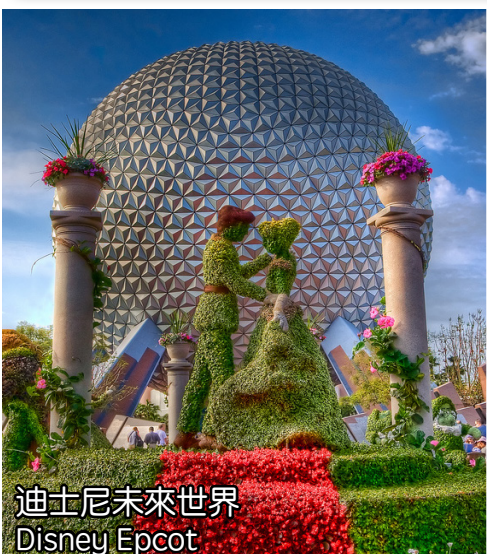
迪士尼未來世界 Disney Epcot