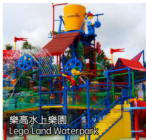
樂高水上樂園 Lego Land Waterpark

這是全球第二大的樂高樂園, 園區建築都由樂高積木組成, 您可以在這裡欣賞到景緻逼真的Lego City!