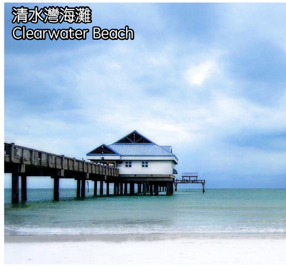
清水灣海灘 Clearwater Beach