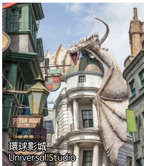
環球影城 Universal Studio

帶您來到植被茂密的熱帶綠洲環境, 全方位波浪池, 沙灘, 穿行在火山岩洞中的懶人河, 家庭漂流項目, 從火山頂滑下來的水上滑道和全新排隊體驗, 感受全新沉浸式體驗。