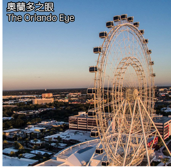
奧蘭多之眼 The Orlando Eye