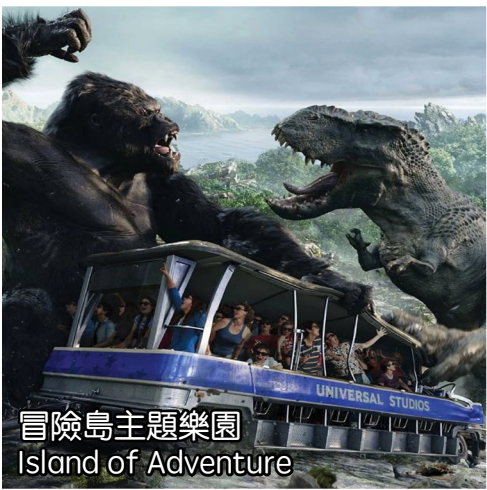
冒險島主題樂園 Island of Adventure

擁有含金量非常高的遊戲項目, 值得您一玩再玩, 變形金剛3D秀, 小黃人動感電影, 哈利波特園區, 還可以從環球搭乘霍格沃茨火車去冒險島。