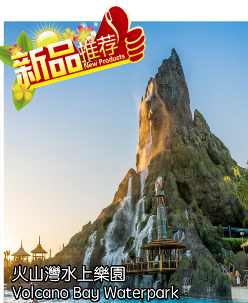
火山灣水上樂園 Volcano Bay Waterpark

帶您來到植被茂密的熱帶綠洲環境, 全方位波浪池, 沙灘, 穿行在火山岩洞中的懶人河, 家庭漂流項目, 從火山頂滑下來的水上滑道和全新排隊體驗, 感受全新沉浸式體驗。