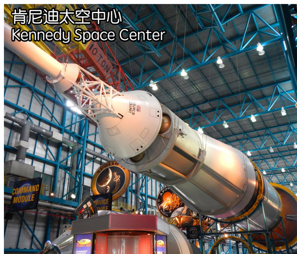
肯尼迪太空中心 Kennedy Space Center

上車信息: Radisson Celebration Resort 9:00AM 2900 Parkway Blvd, Kissimmee, FL 34747