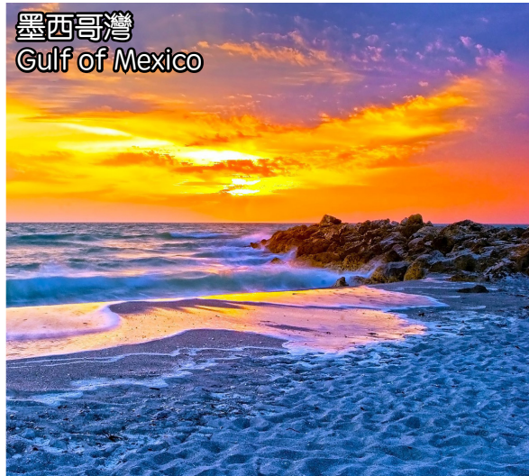
墨西哥灣 Gulf of Mexico

清晨前往位於墨西哥灣的著名海釣聖地, 進行半日海釣。不會釣魚的朋友們也不必擔心, 海釣的魅力就在於, 無論有無經驗, 都可以大顯身手。時常見到第一次釣魚的小朋友就收穫十幾條大魚呢! 這裡的海域有大量的名貴肉食魚, 如紅鯛, 石斑, 海鱸等, 甚至還會釣到鯊魚哦。釣上來的魚船員會為您切成魚片, 魚片可以在附近餐館進行加工, 經濟實惠, 新鮮美味。品嚐過自己的戰利品後, 將繼續遊覽號稱全美國最美海灘的清水灣海灘, 這裡曾經創下一年364個晴天的吉尼斯世界紀錄, 這裡海天一色, 白沙如雪, 漫步於沙灘之上, 您將徹底融入碧藍藍天之中。屆時團友可選擇搭乘美國最大快艇, 出海尋找海豚。或是參觀清水灣海洋水族館, 這裡是非盈利的海上動物保護基地, 居住著全世界最著名的海豚Winter, 就是好萊塢電影《海豚故事1&2》裡的主角, 這部充滿溫情的電影也是這裡拍攝的哦。遊客亦可徜徉於沙灘, 這裡還有眾多海上活動, 降落傘衝浪, 摩托快艇等等。大概傍晚6點鐘, 返回出發地。 In the morning, we're heading to the city of Clearwater, and visit Clearwater Beach which is the most beautiful beach in America and characterized by white sand beaches stretching for 2.5 miles along the Gulf and sits on a barrier island. We are going to have a deep sea fishing. Later we also able to visit Clearwater Marine Aquarium. We return to Orlando at 6:00PM.