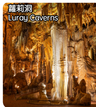
蘿莉洞 Luray Caverns