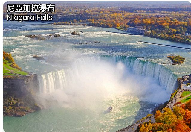
尼亞加拉瀑布 Niagara Falls

價格: 1st, 2nd $140/each, 3rd, 4th $100/each, Single $190