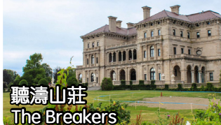
聽濤山莊 The Breakers