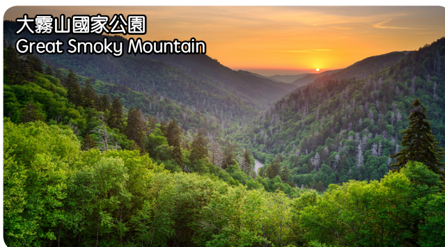
大霧山國家公園 Great Smoky Mountain

價格: 1st, 2nd $220/each, 3rd Free, 4th $135, Single $370