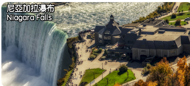
尼亞加拉瀑布 Niagara Falls