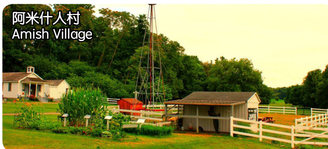
阿米什人村 Amish Village

價格: 1st, 2nd $192/each, 3rd Free, 4th $128, Single $342