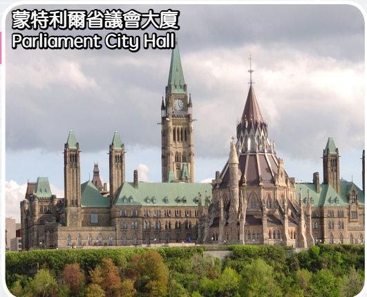
蒙特利爾省議會大廈 Parliament City Hall