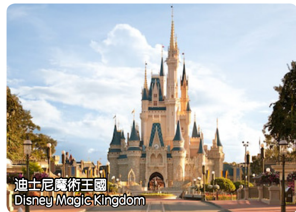
迪士尼魔術王國 Disney Magic Kingdom