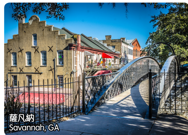
薩凡納 Savannah, GA

價格: 1st, 2nd $555/each, 3rd, 4th $355/each, Single $905