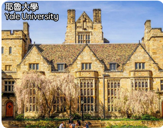
耶魯大學 Yale University