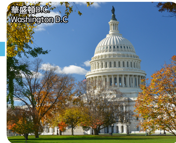
華盛頓D.C. Washington D.C