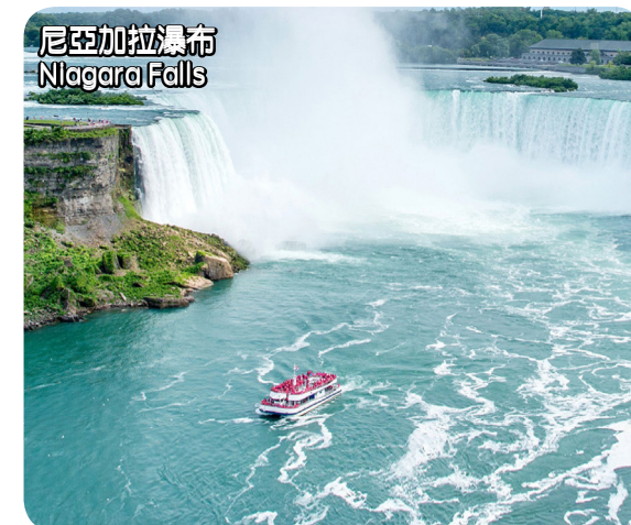
尼亞加拉瀑布 Niagara Falls