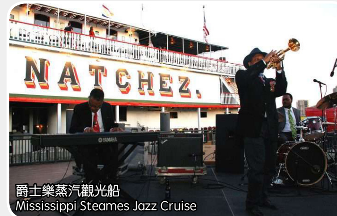
爵士樂蒸汽觀光船 Mississippi Steames Jazz Cruise