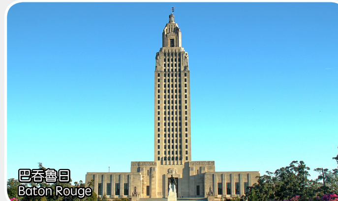
巴吞魯日 Baton Rouge