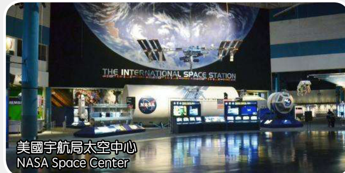
美國宇航局太空中心 NASA Space Center