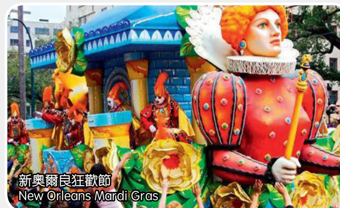
新奧爾良狂歡節 New Orleans Mardi Gras