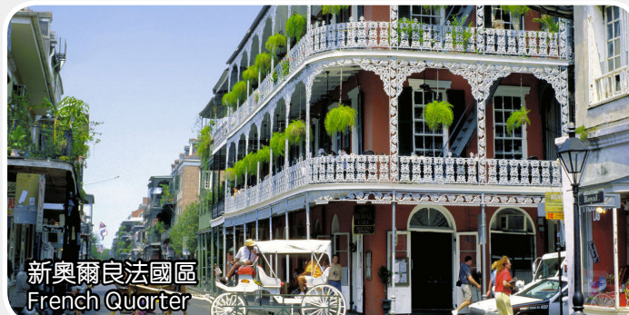
新奧爾良法國區 French Quarter