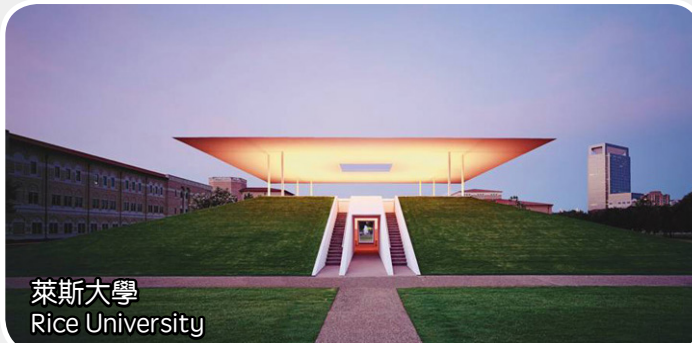
萊斯大學 Rice University